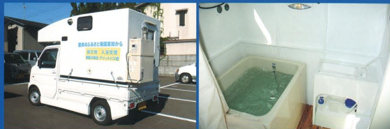
軽トラに搭載できるコンテナ内に、バスタブとシャワー設備、もちろん更衣室も備わった災害支援入浴車です。(2人入浴可能)