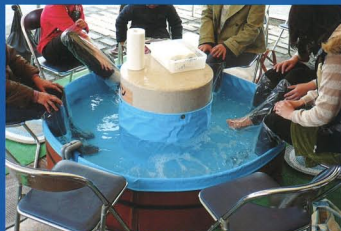
レンタル専用 低価格足湯浴槽ユニット

大掛かりな工事は不要で、場所を選ばず簡単に設置でき、すぐ稼働できるFRP製の足湯浴槽に、循環湯浴システムによる強制循環ろ過装置が付いた足湯浴槽です。